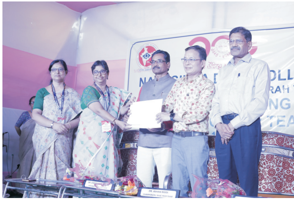
ন্যাক শংসাপত্র পেল কলেজ