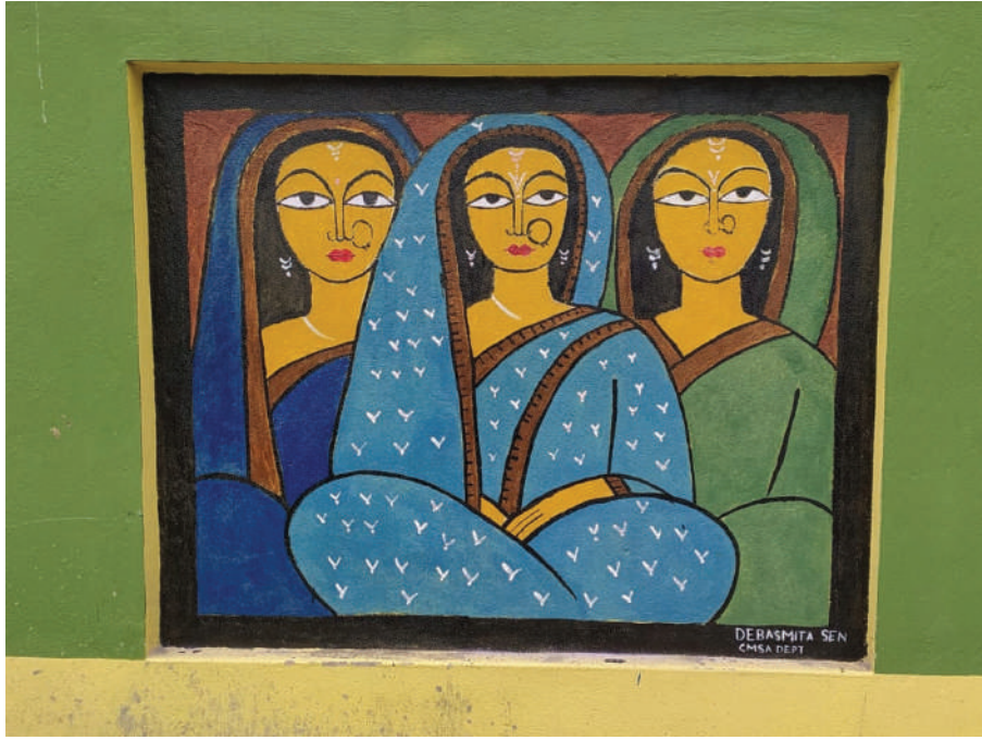
দেওয়াল চিত্রের শিল্পী : দেবস্মিতা সেন, রাজদীপ খান, অয়ন দাস