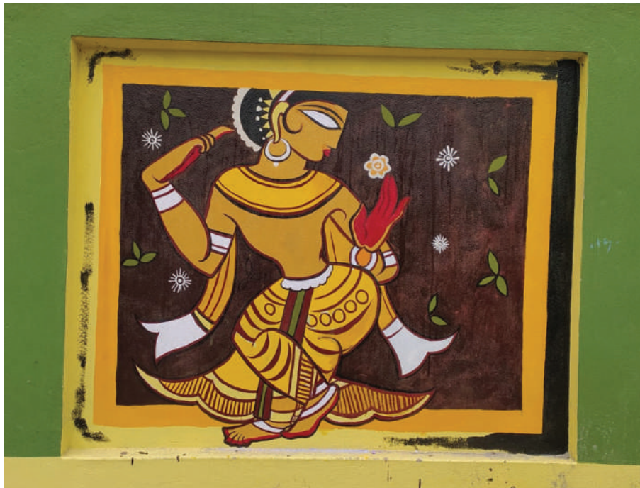
দেওয়াল চিত্রের শিল্পী : সুনীতা মাখাল, সেখ দিলার, অয়ন দাস, রাহুল পাল, রাজর্ষি দত্ত, মৈনাক, সুরজ সাহিন