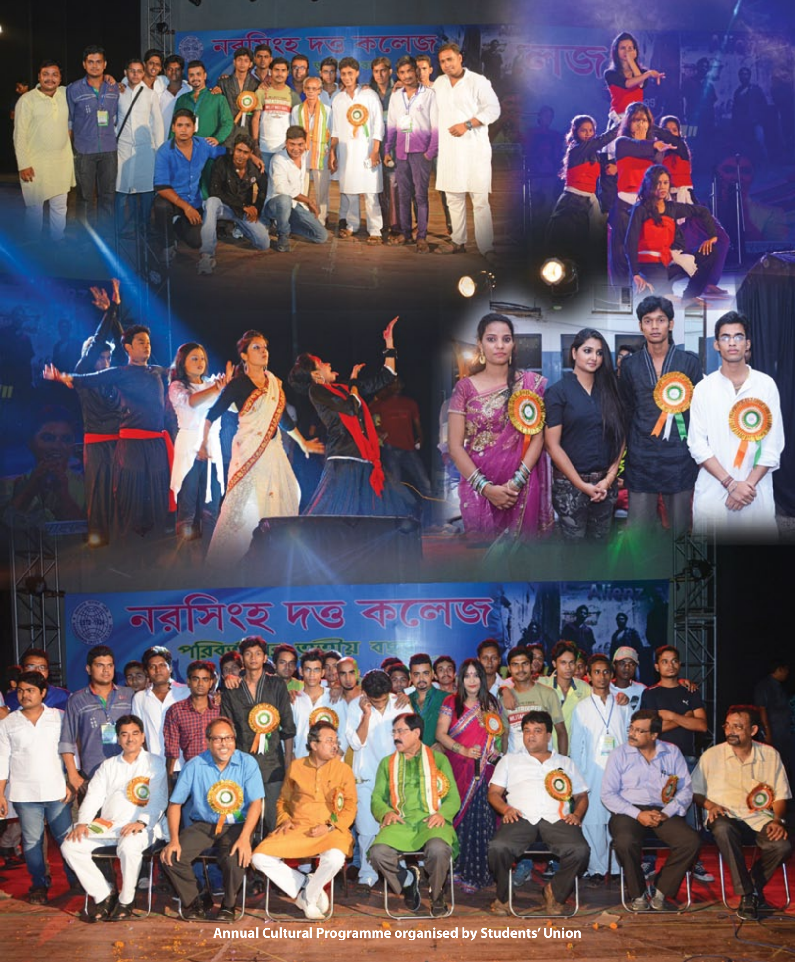
Annual Cultural Programme organised by Students' Union