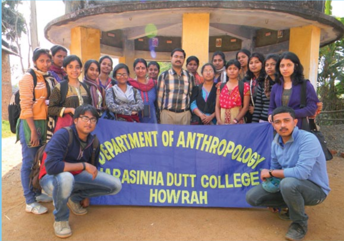
Final year Anthropology Honours students in the Fieldwork at Khatna, Bankura.