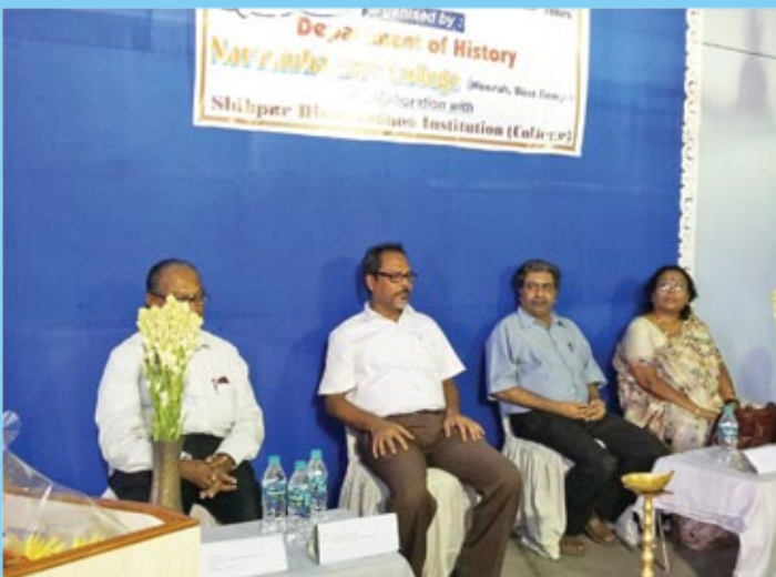
UGC sponsored seminar in the Department of History