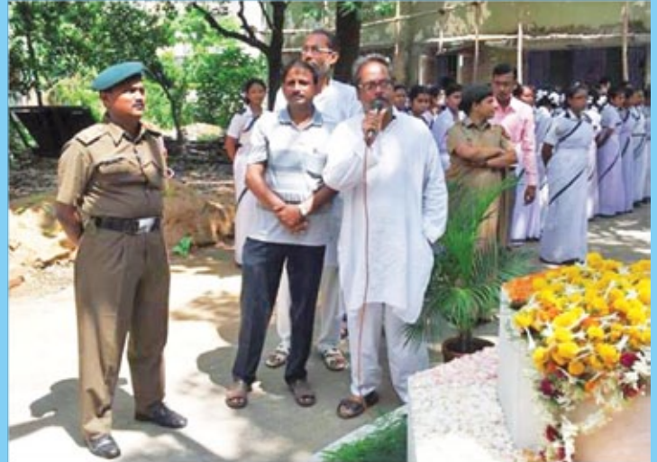
Independence Day Celebration – Principal's address on the occasion