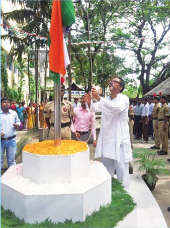
Independence Day Celebration – Flag hoisting by the Principal