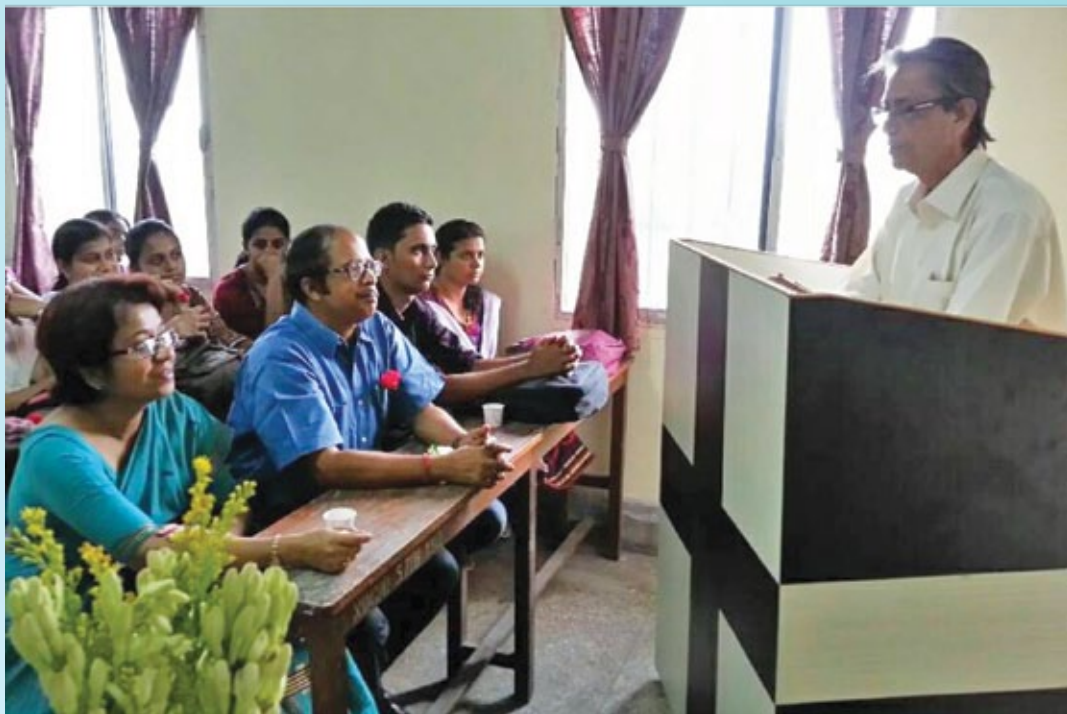
Inauguration Programme of Post Graduate study in English