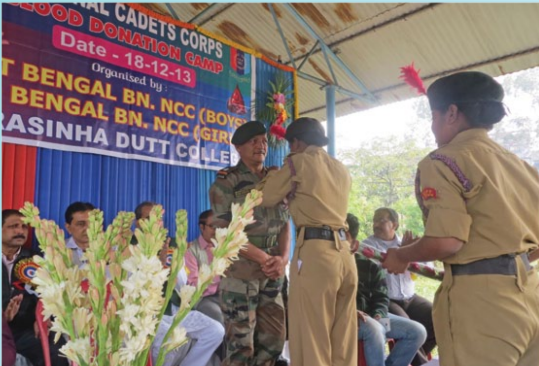
Blood Donation Camp organised by NCC