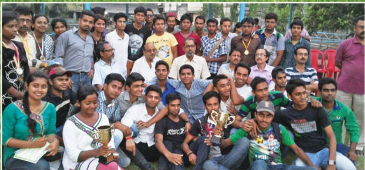
Achievements by our students in All India Meet & College Annual Sports organised by Students' Union