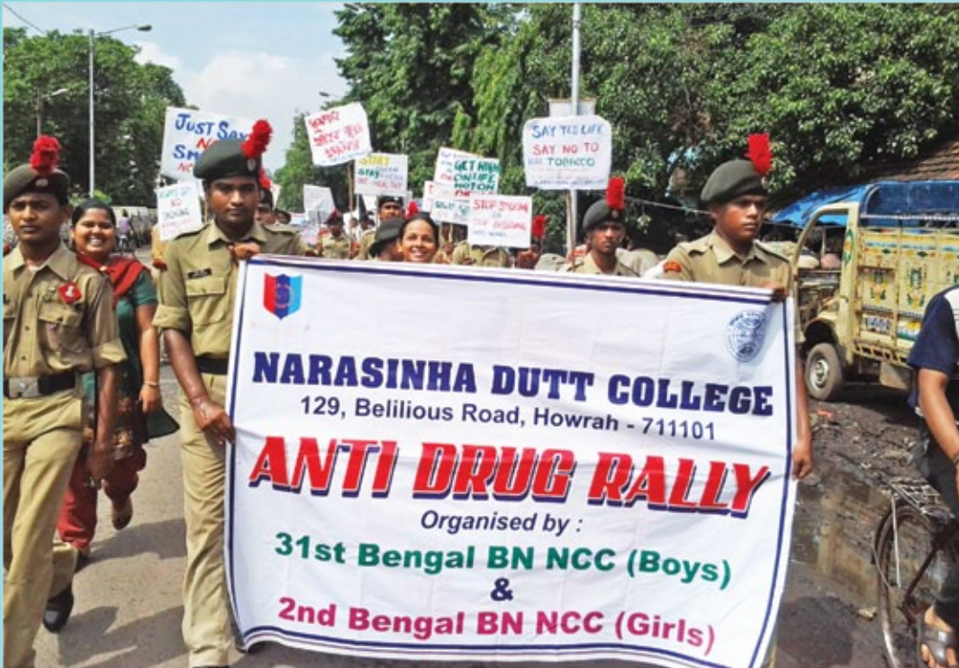
Anti-Drug Rally organised by NCC