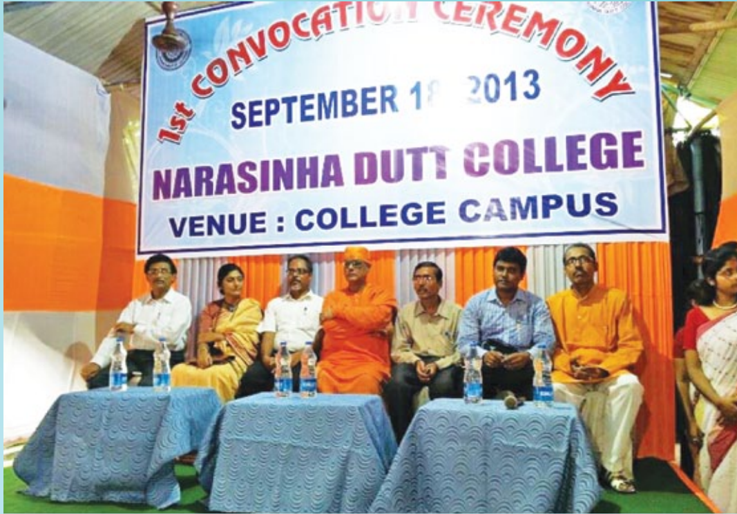
First Convocation Ceremony of Post Graduate students