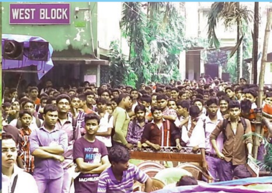
Freshers' Welcome Ceremony organised by Students' Union